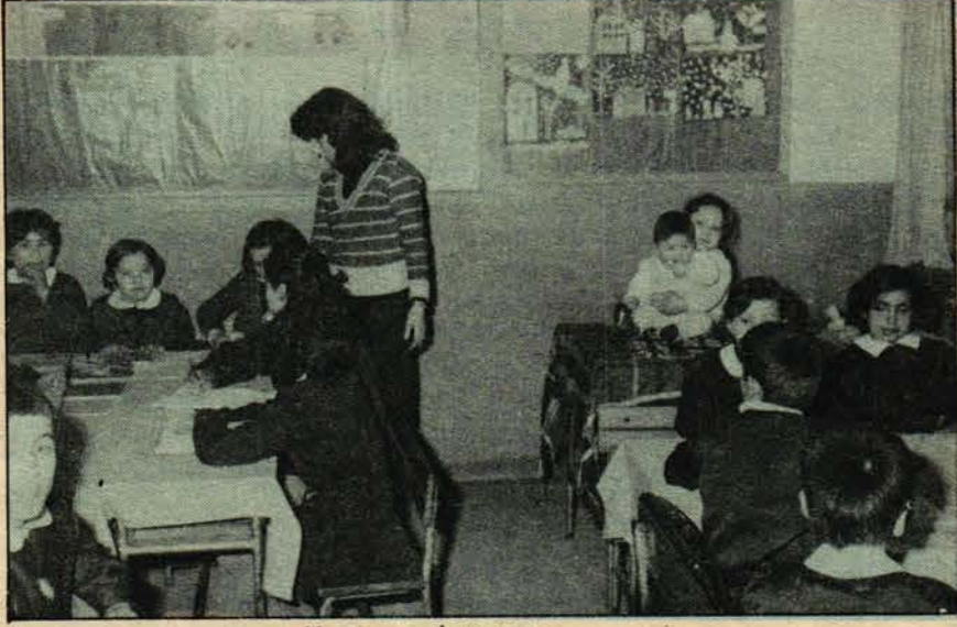
Kreş ve dersane

Çocuklarımız! Biz kadın öğretmenlerin büyük sorunu. İşimize giderken onları nereye, kime bırakacağız?. Bıraktığımız yer, kişi güvenli mi? Yanımızda götürsek okul idaresi, müfettişler ne der? Çocuklarımızı nasıl büyütüp yetiştireceğiz?