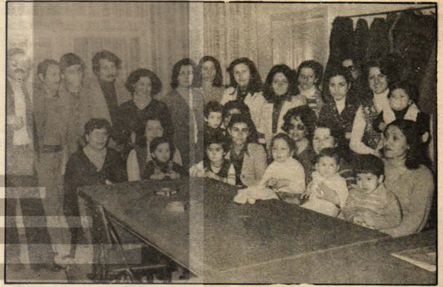
Feriköy İlkokulu öğretmenleri kreş sorununu tartışıyor.

Artık, günümüzde, kadın öğretmenler çocuklarına nasıl bakılacağına ve sorunlarının nasıl çözümleneceğinin bilincindedirler. Hak almanın birliği ve dayanışma ile sağlanacağını bilecek çocuklarına mutlu ve özgür bir yaşam için yığınsal olarak savaşımını sürdürüyorlar.