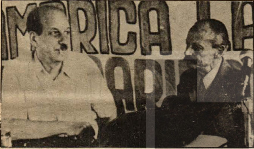
DSF Genel Başkanı

16 - 23 Nisan 1978 tarihleri arasında Çekoslovakya Sosyalist Cumhuriyeti başkenti Prag'ta Dünya Sendikalar Federasyonu'nun IX. Genel Kurulu toplanıyor. DSF, 180 milyon işçi ve emekçiyi temsil eden üye sendikalara aşağıda kısaltarak sunacağımız «Sendikal Haklar Evrensel Beyannamesi» ve «Yönlendirme ve Eylem Taslağı» başlıklı bir program sunacak. Program IX. Dünya Sendikal Kongresinde tartışılarak, kesinleşecek.