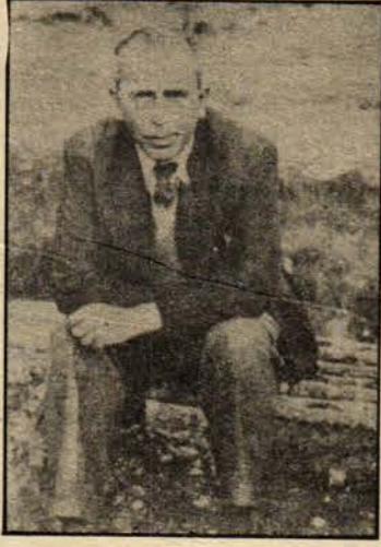
İ. Hakkı Tonguç

İ. Hakkı Tonguç'un ve H. Ali Yücel'in önderlik ettiği Köy Enstitüleri hareketi, kırsal bölgedeki okuma yazmazlıkla mücadele etmek, feodal değer yargılarını etkisizleştirmek ve köyü uyarmak amacını güdüyordu. Üretimle iç içe eğitim, öğrencilerin eğitime katılması Köy Enstitülerinin belirgin özelliğiydi. Yoksul köy çocuklarını da bağrında toplayan ve nisbi demokratik özerkliğe sahip Köy Enstitüleri kısa sürede yirmi bin mezun verdi. Köy Enstitüleri kapitalizmin kır